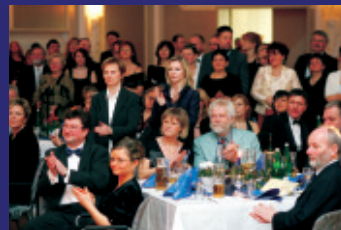
Applaus für die Kinder-Breakdancegruppe