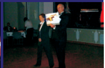
Übergabe des Hauptpreises bei der Tombola-Verlosung