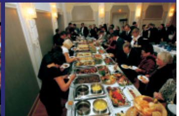
Das Buffet vom „Schwarzen Adler“ aus Bernau