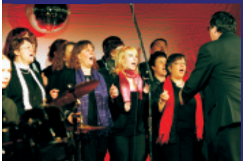
Der Gospelchor Westend unter der Leitung von Pfarrer Giering